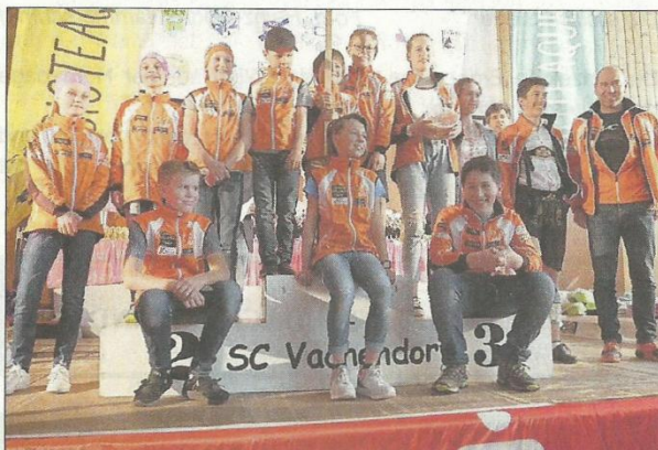
Die erfolgreichen Marquartsteiner

Zustande kam dieser Erfolg durch unsere langlaufbegeisterten Rennläufer, die sich an mehreren Wochenenden bei Wind und Wetter an den Wettkämpfen beteiligten und durch viele gute Platzierungen die entsprechenden Punkte für sich und den Verein sammelten. Mehrere Podest- und TopTen-Plätze konnten in der Gesamtwertung erreicht werden und die Pokale und Sachpreise für alle Teilnehmer waren mehr als verdient.