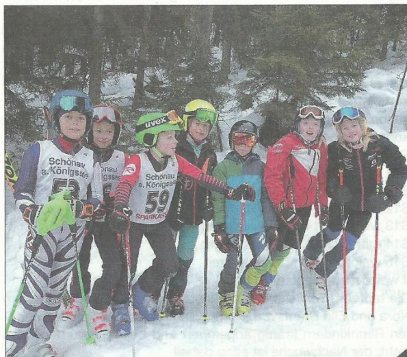
Das Team aus dem Achenal