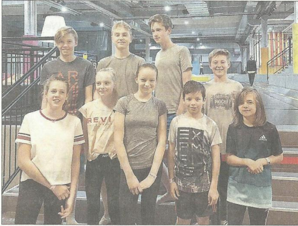
Das Team „Rennsemmeln“ in der Trampolinhalle

Bei der Clubmeisterschaft Ski-Alpin des TSV Marquartstein im Januar gewannen die „Rennsemmeln“ den Preis des schnellsten Teams und waren somit zu einem Ausflug in die Trampolinhalle „MaxxArena“ in Kirchheim b. München eingeladen.