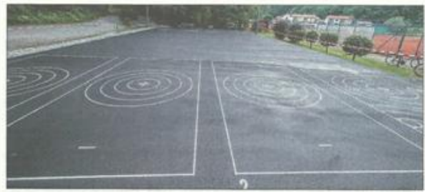
Der sanierte Platz