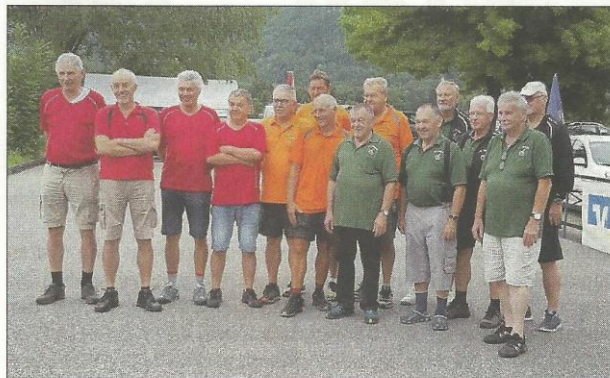
Marquartstein - Schlossberg - Reifing