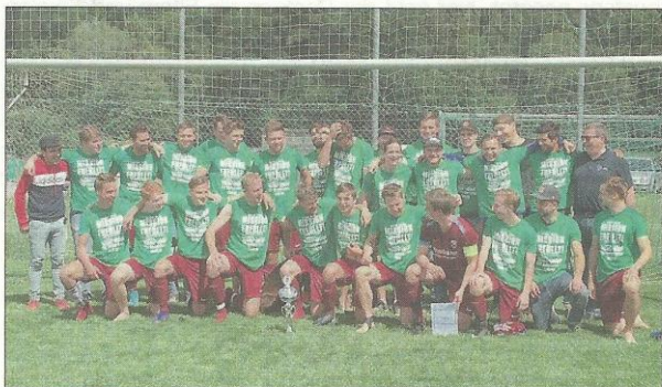
Aufstieg und Meister 2019