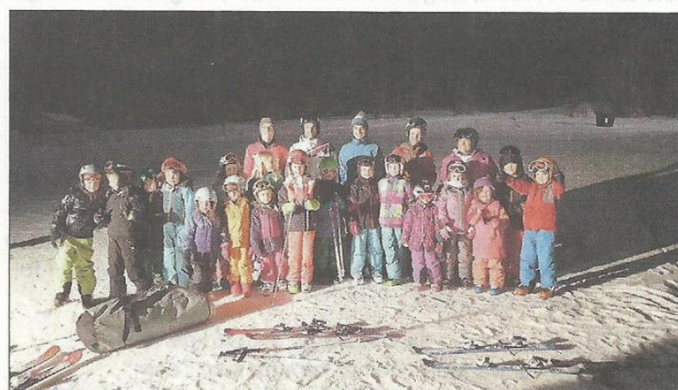
Trainingsteam am Balsberg