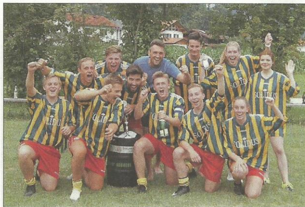
SC Bologna „Sieger des Turniers“