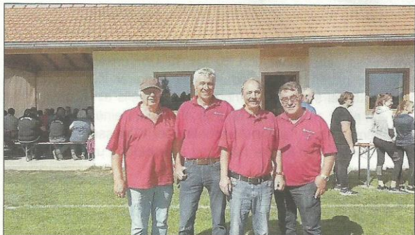
So sehen Aufsteiger aus!