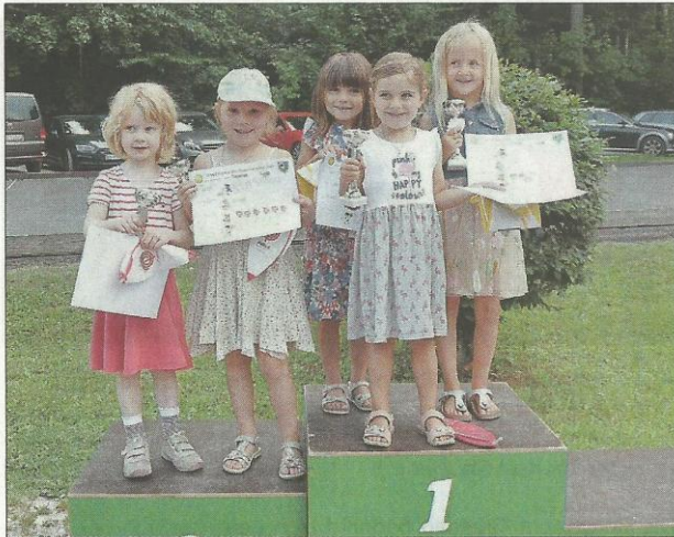
Die jüngsten Sieger der diesjährigen Tennis-Clubmeisterschaft (Kleinfeld-Minis)